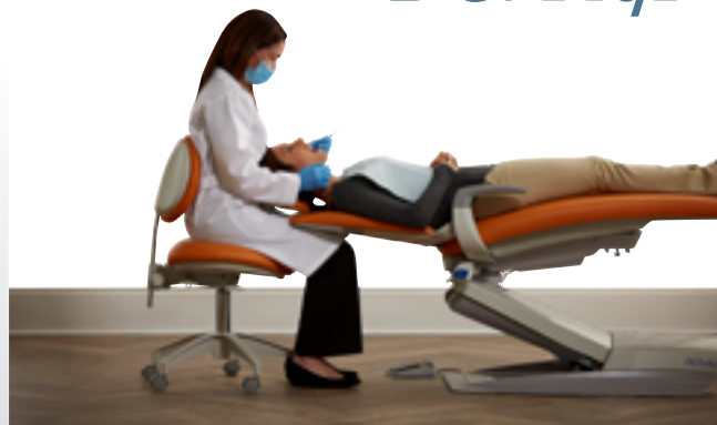
Rozwiązanie amerykańskiej firmy DCI EDGE